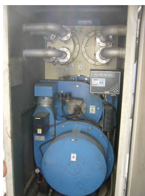
図2 事業実施前 灯油焚き温水ボイラー