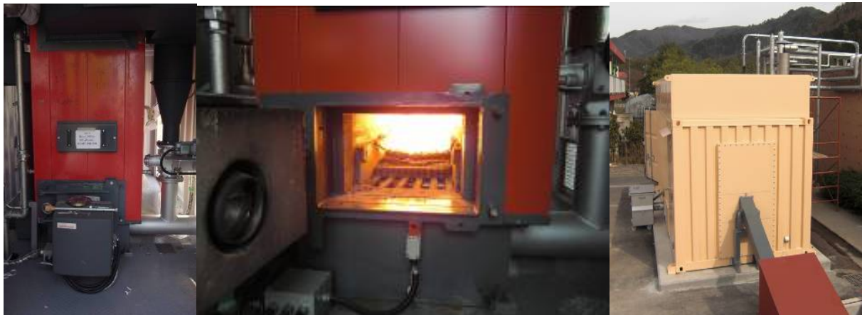
図4 事業実施後 バイオマス焼き温水ボイラー