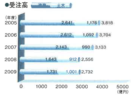
■受注高・完工高の推移