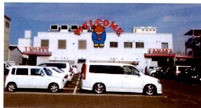
■建物全体の写真(図の左から見て)