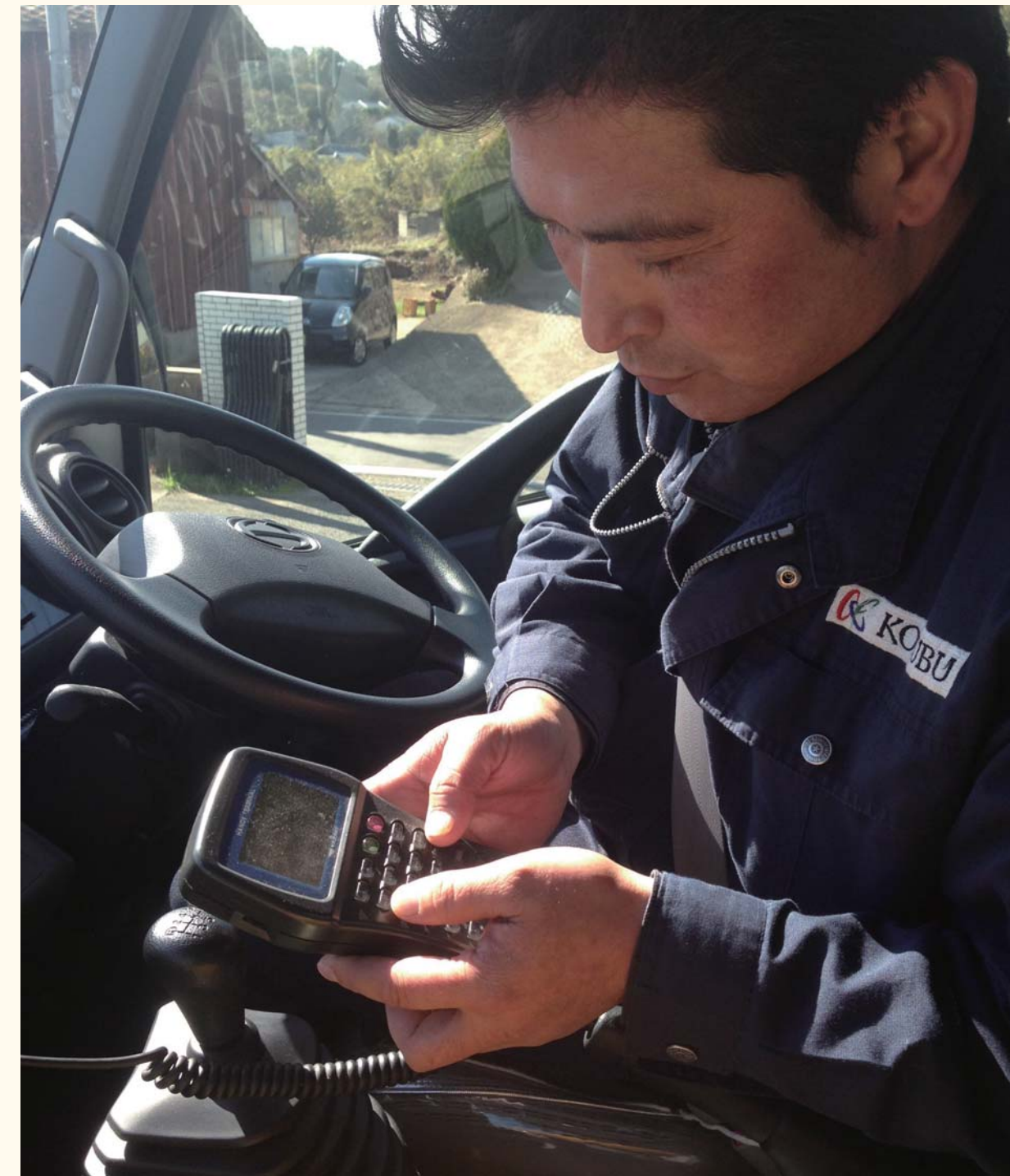
デジタルタコグラフ端末の操作中

トラックにデジタルタコグラフを装着し、エコドライブを推進しました。これにより、燃料使用量を削減し、年間約20tのCO 2 排出量を削減しました。