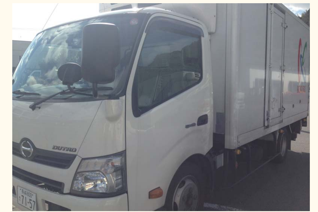
九州国分のトラック