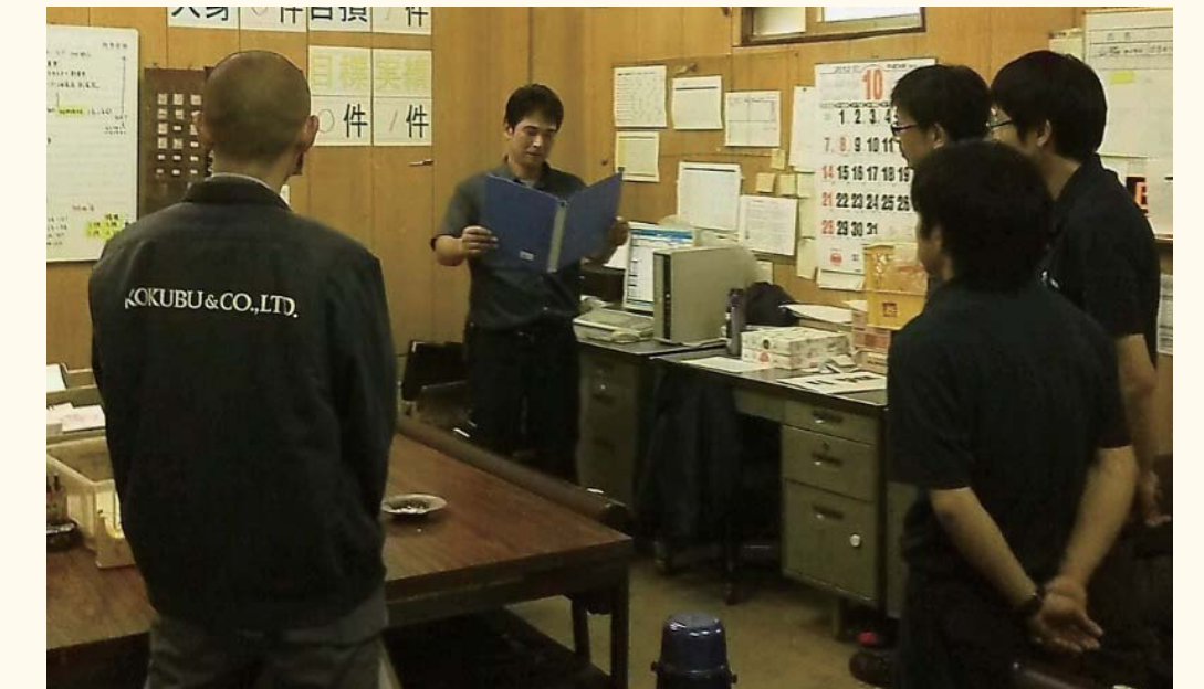
エコドライブ実施のための朝礼