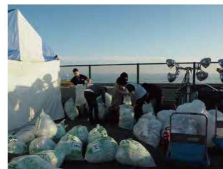
来年の大会の為に荷物袋を回収しました！