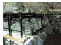
ランナーの荷物預け所